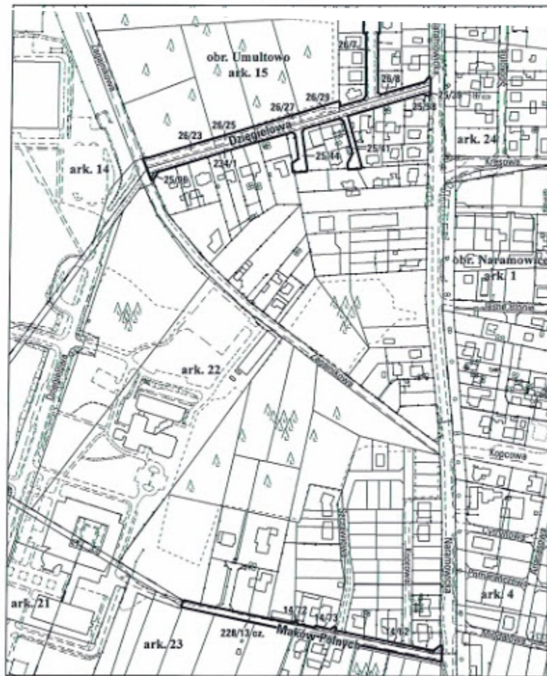
Miasto Poznań; obręb Umultowo, arkusz 15, 22, 23

( https://3.bp.blogspot.com/-TXYERNheq4g/V0gG8Fd1Ypl/AAAAAAAAACCE/PkJivs2zY-AfqJ-f0RoWOazQMSJ7zWsYACLcB/s1600/makow%2Bpolnych.jpg )