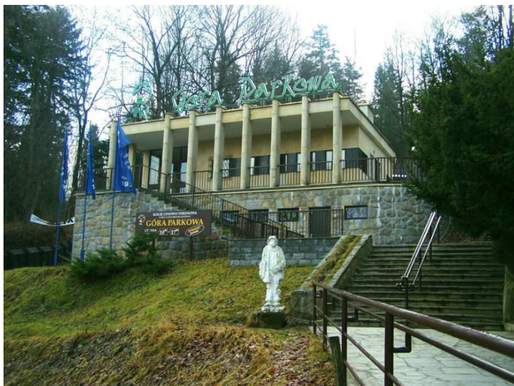
Fot. 21. Dolna stacja Kolei na Górę Parkową (1937), źródło ilustracji: www.wikipedia.org , fot. Jerzy Opiola.

W okresie międzywojennym Krynica zyskała uznanie w całym kraju, a także w Europie. Kulturalny wielonarodowościowy klimat ówczesnej Krynicy współtworzyli Polacy, Żydzi i Łemkowie. Gośćmi uzdrowiska bywali słynni politycy i osobistości świata kultury.