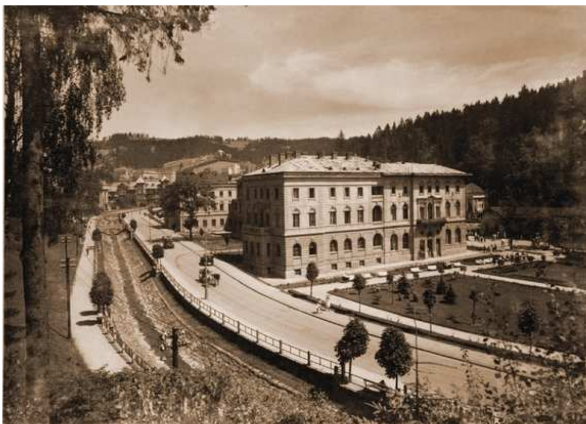
Fot. 2. Bulwary Dietla, źródło ilustracji: www.ukz.nazwa.pl

Rosnąca popularność Krynicy wpłynęła na kształtowanie się układu urbanistycznego. Za sprawą prof. Józefa Dietla podjęto decyzję o utworzeniu Bulwarów oraz krytego Deptaka Szwajcarskiego, co wiązało się z koniecznością wycinki drzew wokół źródeł, a zarazem przysporzyło materiału budowlanego, stymulując rozwój architektury drewnianej 8 .