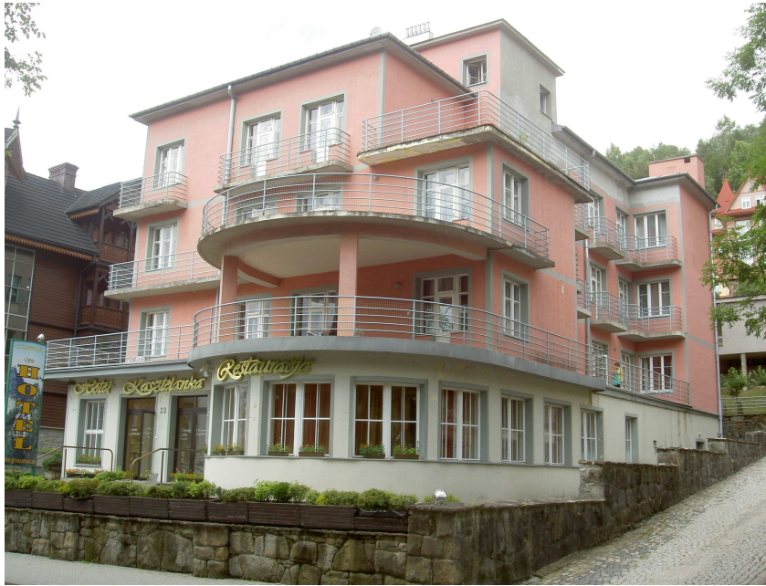
Fot. 18. Pensjonat Kasztelanka, fot. autorki.

Wiele willi utrzymanych było w nurcie klasycystycznym lub dworskowym. Profesor Elżbieta Węclawowicz – Bilśka, autorka monografii Uzdrowiska Polskie , tak charakteryzuje ten typ zabudowy uzdrowskiej: „Obiekty mieszkalne realizowane we wczesnym okresie kreacji założenia, położone najbliżej terenów leczniczych, nawiązywały do powszechnie obowiązujących wzorów architektury pałacowo – dworskiej, wznoszone zarówno z drewna jak i w konstrukcji murowej. W latach 30. XX w. pojawiły się obiekty awangardowej architektury modernistycznej o płynnych liniach balkonów, perfekcyjnych proporcjach, wykończone szlachetnymi materiałami i okładzinami z naturalnego kamienia” 32 . Przykłady architektury willowo – pensjonatowej nurtu dworskiego w Krynicy to: Małopolanka , Leśna Polana , czy Dworek pod Blachą . Nurt funkcjonalistyczny reprezentują między innymi pensjonaty Bajka , Exploris , Tryumfy czy Żółta Róża . Na uwagę zasługuje usytuowana na zboczu Góry Parkowej - Willa Prezydencka, autorstwa arch. Romualda Gutta, której bryłę włączono w budynek obecnego Hotelu Prezydent.