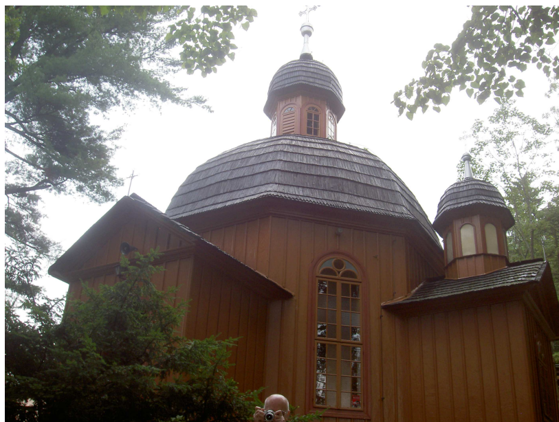
Fot. 5. Kościół Parkowy (1863), fot. autorki.

W 1863 roku zrealizowano inny projekt drewnianej świątyni, zbudowanej na planie krzyża, o konstrukcji zrębowej, szalowanej, z dachem krytym gontem 12 . Kaplica – nazywana Kościółem Parkowym , zawiera motywy inspirowane architekturą cerkiewną. Jej wyposażenie stanowią dwa ołtarze z przełomu XIX i XX stulecia z obrazami ukazującym Przemienienie Pańskie i Matkę Bożą Częstochowską 13 .