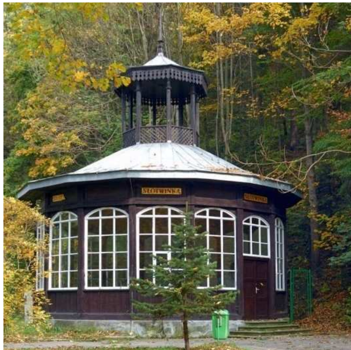
Fot. 1. Dawny pawilon Pijalni nad Zdrojem Głównym – obecnie Pijalnia Słotwinka , źródło ilustracji: www.krynica.pl

Pierwsza połowa XIX wieku wiąże się z budową pierwszych obiektów związanych z funkcją uzdrowiskową Krynicy, a tym samym z rozwojem architektury drewnianej. W roku 1804 wzniesiono pierwszy budynek Łazienek Mineralnych, tzw. Mały Domek , a w 1808 roku pawilon Pijalni nad Zdrojem Głównym, zbudowany w formie kolistej altany, z dachem zwieńczonym latarnią, w modnym wówczas stylu chińskim, połączony z krytym deptakiem, autorstwa Burggalera 3 . W roku 1863 ten pierwszy uzdrowiskowy obiekt przeniesiono Parku Słotwińskiego, położonego wzdłuż ulicy Piłsudskiego.