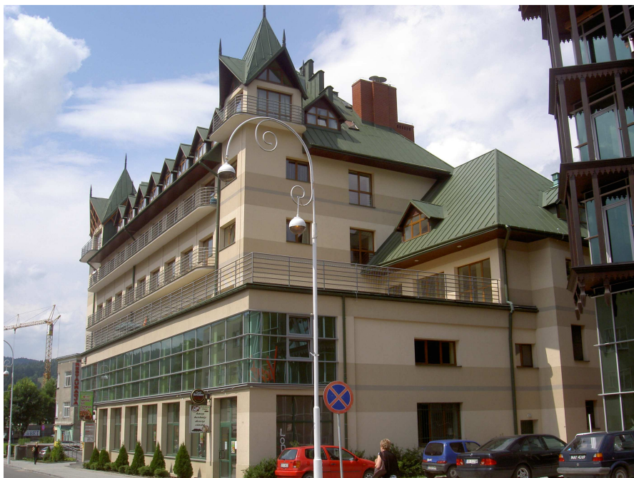
Fot. 15. Dawny Oficerski Dom Wypoczynkowy (1938) po przebudowie, arch. Adolf Szyszko – Bogusz

Cennym budynkiem z tego okresu był także Oficerski Dom Wypoczynkowy przy ul. Pułaskiego, autorstwa prof. Adolfa Szyszko – Bohusza, znakomitego architekta, założyciela Wydziału Architektury Politechniki Krakowskiej, autora między innymi Banku PKO, Domu Plastyka w Krakowie, a także Domu Zdrojowego w Żegiestowie. W ostatnim czasie Oficerski Dom Wypoczynkowy został przebudowany, co pociągnęło za sobą znaczne zmiany i zniszczenie pierwotnej tkanki architektonicznej 29 .