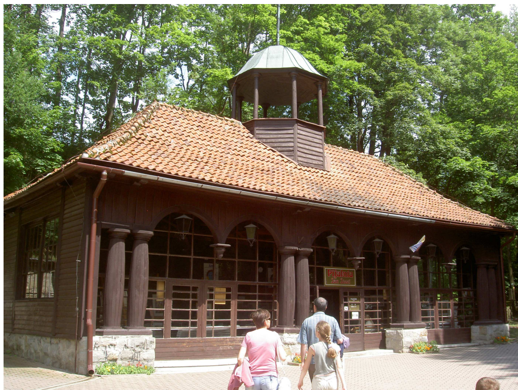
Fot. 20. Pijalnia Jana i Józefa (1929 – 33), fot. autorki.

Na przełomie lat 20. i 30. na miejscu XIX – wiecznych pawilonów nad źródłami Jana i Józefa na terenie Parku Zdrojowego , u podnóża Góry Parkowej wzniesiono nowy drewniany budynek – obecną Pijalnię Jana i Józefa (1929 – 1933).