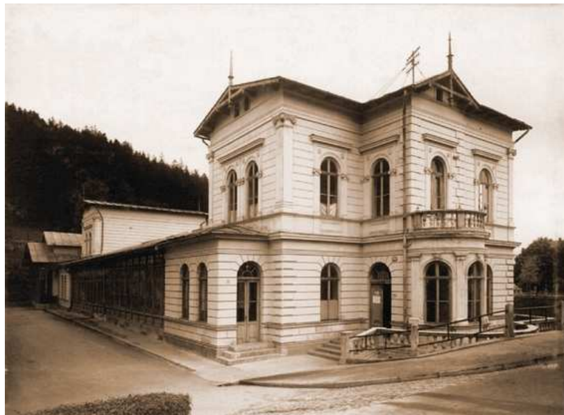
Fot. 4. Łazienki Borowinowe (1880) arch. Feliks Księgarski

W roku 1880 ukończono utrzymane w stylu eklektycznym Łazienki Borowinowe – także autorstwa arch. Feliksa Księgarskiego. Otwarcie tych ważnych i prestiżowych obiektów uzdrowiskowych, znacząco wpłynęło na dalszy rozwój Krynicy.