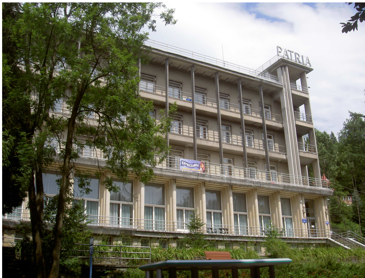
Fot. 17. Pensjonat Patria (1936 – 38), arch. Bohdan Pniewski.

W Krynicy powstało w okresie międzywojennym sporo pensjonatów, hoteli i prywatnych willi. Wśród nich miejsce szczególne zajmuje hotel Patria Jana Kiepury wybudowany w latach 1936 – 38 przez wybitnego polskiego architekta Bohdana Pniewskiego, autora gmachu Sejmu Polskiego i Teatru Wielkiego w Warszawie.