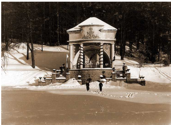
Fot. 12. Muszla Koncertowa