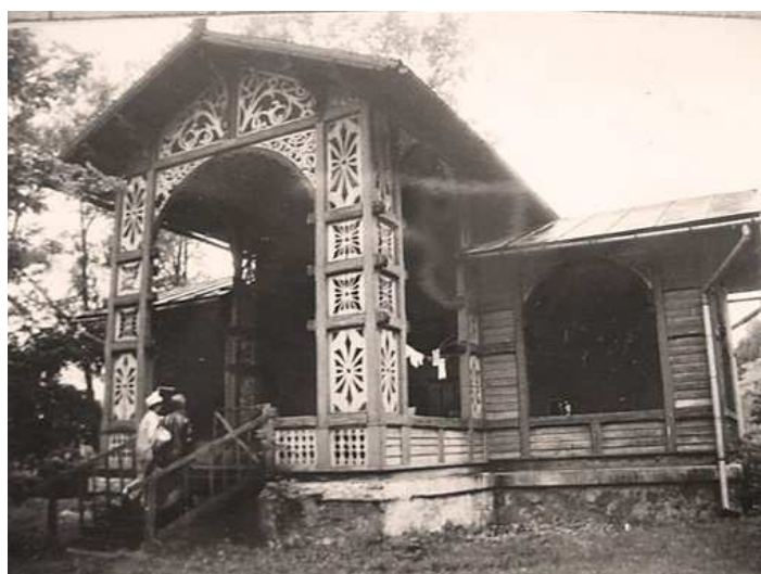
Fot. 7. Budynek pawilonu dla orkiestry (1870) – obecnie Restauracja Koncertowa, źródło ilustracji: www.restaurajakoncertowa.pl

Na skraju Parku Słotwińskiego w roku 1870 usytuowano ażurowy drewniany pawilon dla orkiestry, która koncertowała na wolnym powietrzu. Obecnie mieści on restaurację Koncertową .