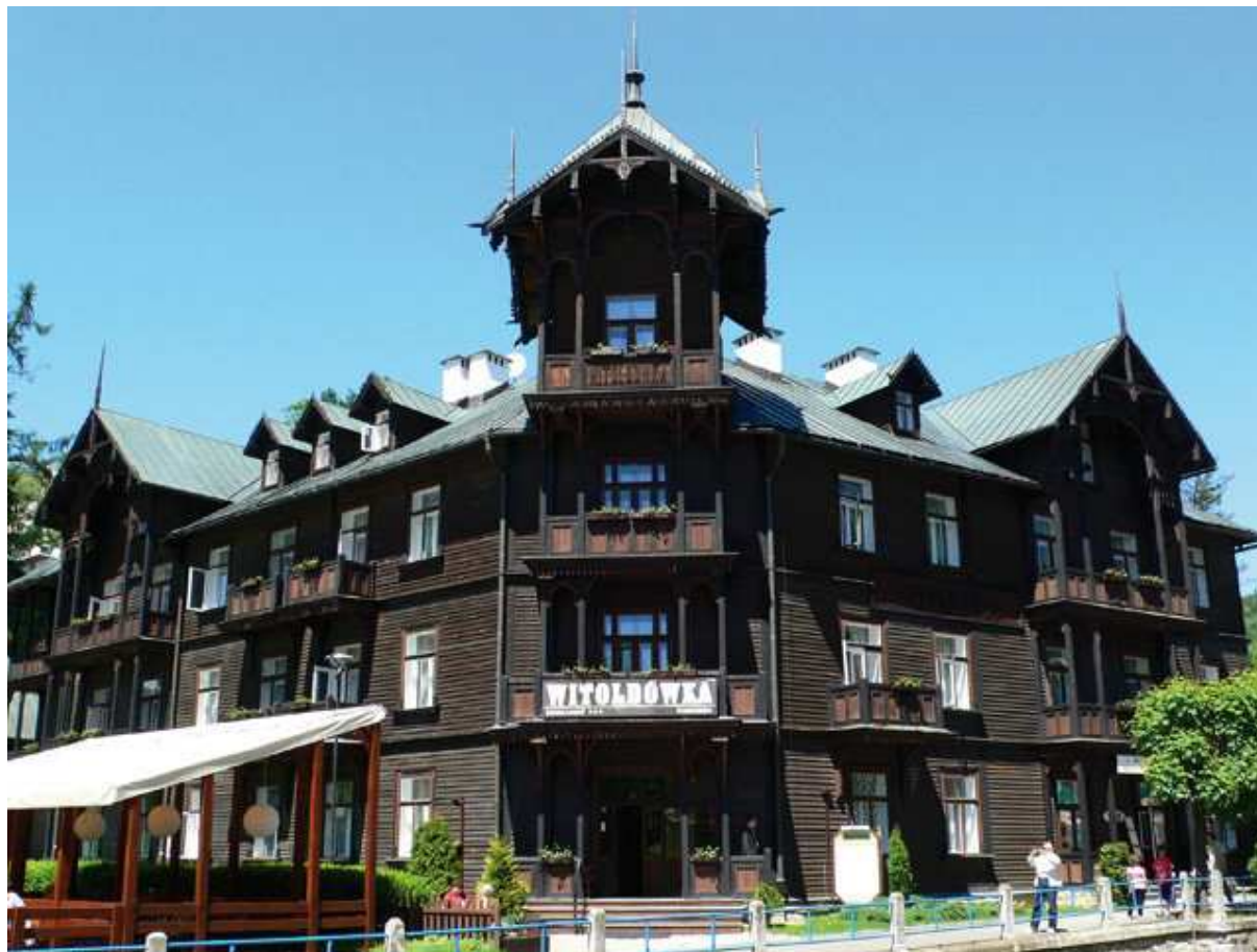
Fot. 10. Willa Witoldówka (1888) arch. Jan Zawiejski (prawdopodobnie), źródło ilustracji: www.gazeta.pl , fot. Ireneusz Dańko

zleceńodawcy dr Bolesława Skórczewskiego, Zawiejski przeprojektowuje obie wille na zrealizowane później budynki drewniane 21 .