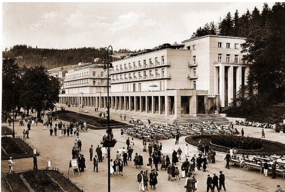
Fot. 14. Nowy Dom Zdrojowy (1939), arch. Witold Minkiewicz

Kolejnym wybitnym architektem projektującym w Krynicy był twórca Katedry Architektury Monumentalnej Politechniki Lwowskiej – prof. Witold Minkiewicz 27 . Był on autorem jednego z najznakomitszych budynków użyteczności publicznej II Rzeczypospolitej – Nowego Domu Zdrojowego w Krynicy, który otwarty został w sezonie letnim 1939 roku.