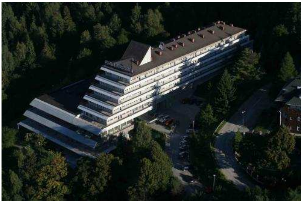
Fot. 24. Sanatorium Budowlani – obecnie Panorama (1972), arch. Mieczysław Gliszczyński

Po wojnie rozbudowano także obiekty sportowe – boiska i korty tenisowe. Wybudowano wiele innych obiektów utrzymanych głównie w nurcie powojennego modernizmu, między innymi Kino – Teatr Jaworzyna oraz Dom Towarowy Perła.