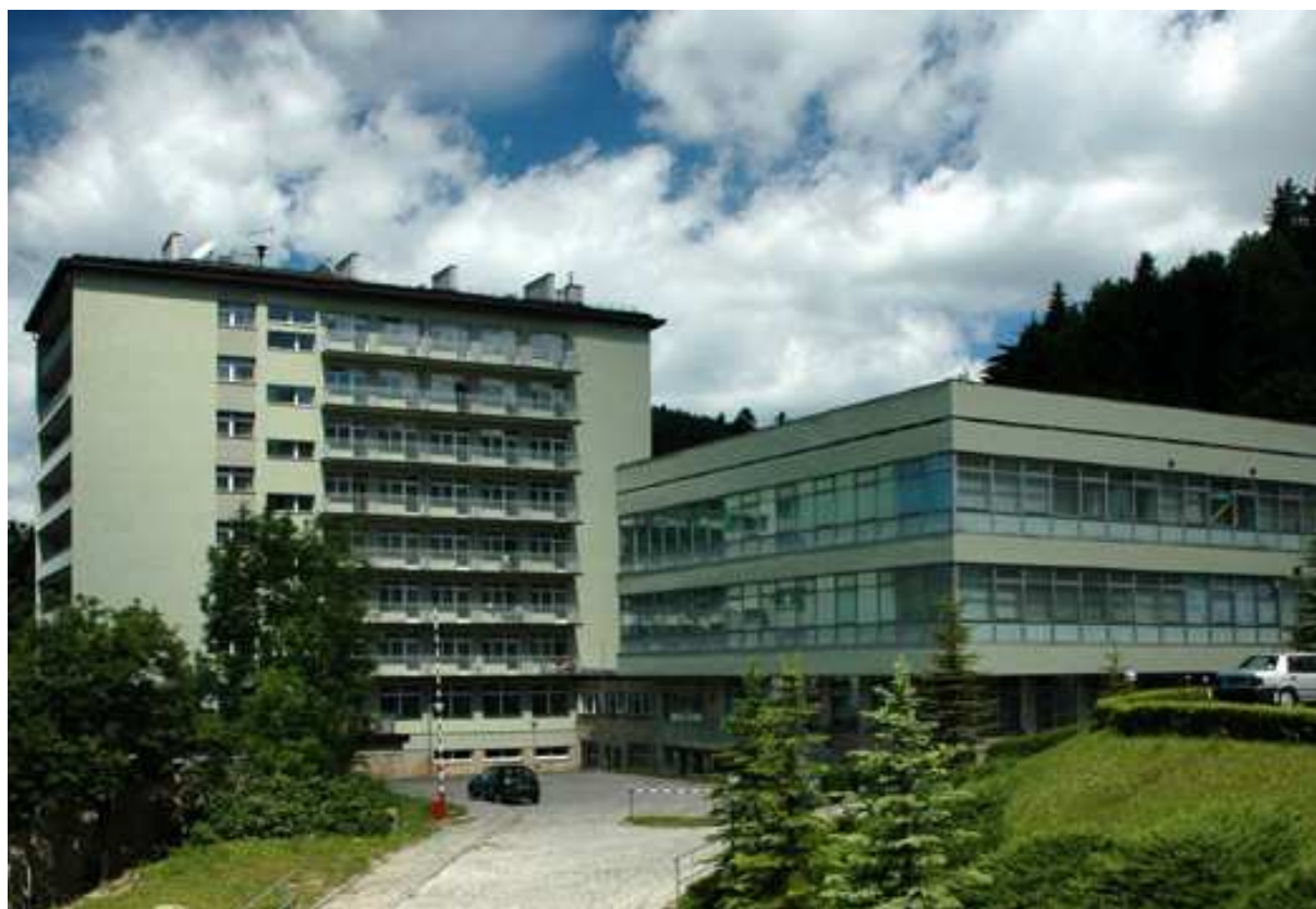
Fot. 23. Sanatorium Silesia – obecnie Damis (1963), arch. Stanisław Spyt i arch. Zbigniew Mikołajewski, źródło ilustracji: www.krynica.damis.pl

Podkreślić należy, iż Krynica powojenna posiadała już skryształizowany układ urbanistyczny, a także główne obiekty architektoniczne związane z funkcją uzdrowską 37 . W roku 1957 utworzono w Polsce tzw. Fundusz Wczasów Pracowniczych, dzięki któremu obywatele socjalistycznej ojczyzny mogli masowo korzystać z elitarnych dotąd uzdrowisk. Ma to doniosły wpływ na liczbę kuracjuszy, co z kolei wpływa na rozwój nowego typu obiektów architektonicznych. Powstają w tym czasie wielokubaturowe sanatoria, których skala niejednokrotnie wielkomięjska, przytłaczała istniejącą w sąsiedztwie zabudowę 38 . Jedną z pierwszych powojennych realizacji w Krynicy było Sanatorium Silesia z 1963 roku, autorstwa arch. Stanisława Spyt i arch. Zbigniewa Mikołajewskiego 39 .