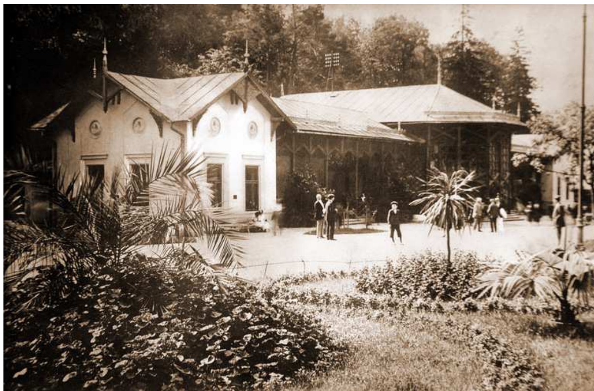
Fot. 6. Stara Pijalnia (1869) arch. Feliks Księżarski

Nie zachował się ważny dla Krynicy obiekt o funkcji uzdrowskowej – drewniany budynek Starej Pijalni projektu arch. Feliksa Księżarskiego z 1869 roku. Ten oryginalny budynek można podziwiać dzięki starym fotografiom. Stara Pijalnia składała się z dwóch części – obudowy źródła oraz krytego deptaka w formie otwartej galerii 14 .