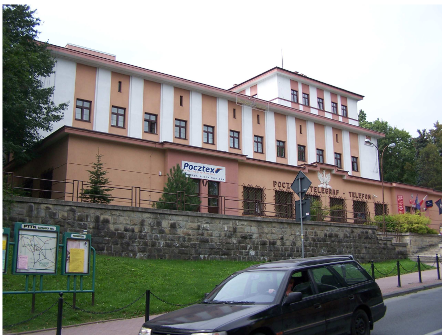
Fot. 16. Budynek Poczty Polskiej, fot. autorki.

Na uznanie zasługują także inne budynki powstałe w latach 30-tych w uzdrowisku: monumentalny Gmach Poczty Polskiej oraz modernistyczny Budynek PKO.