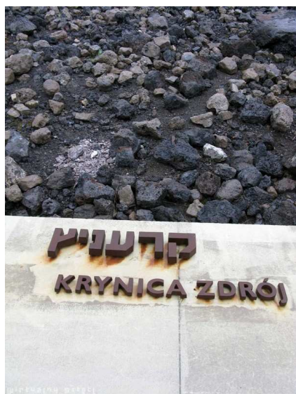
Fot. 22. Tablica pamiątkowa w Bełżcu, źródło ilustracji: www.sztetl.org.pl .

Wybuch II Wojny Światowej hamuje rozwój Krynicy, a jej skutki na trwałe zmieniają kulturowy krajobraz uzdrowiska. Okupacja niemiecka wiązała się z zajęciem całego mienia uzdrowskiego i przekształceniem Krynicy w kurort dla niemieckich oficerów. Mieszkańcy Krynicy w czasie II Wojny Światowej żyli w ciągłym poczuciu zagrożenia. Na przymusowe roboty do Niemiec wywieziono 550 osób. Większość krynickich Żydów zginęła podczas Holocaustu.