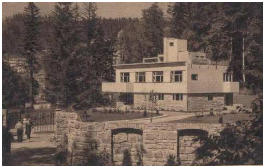
Fot. 19. Willa Prezydencka (1933), arch. Romuald Gutt

Wiele willi utrzymanych było w nurcie klasycystycznym lub dworskowym. Profesor Elżbieta Węclawowicz – Bilśka, autorka monografii Uzdrowiska Polskie , tak charakteryzuje ten typ zabudowy uzdrowskiej: „Obiekty mieszkalne realizowane we wczesnym okresie kreacji założenia, położone najbliżej terenów leczniczych, nawiązywały do powszechnie obowiązujących wzorów architektury pałacowo – dworskiej, wznoszone zarówno z drewna jak i w konstrukcji murowej. W latach 30. XX w. pojawiły się obiekty awangardowej architektury modernistycznej o płynnych liniach balkonów, perfekcyjnych proporcjach, wykończone szlachetnymi materiałami i okładzinami z naturalnego kamienia” 32 . Przykłady architektury willowo – pensjonatowej nurtu dworskiego w Krynicy to: Małopolanka , Leśna Polana , czy Dworek pod Blachą . Nurt funkcjonalistyczny reprezentują między innymi pensjonaty Bajka , Exploris , Tryumfy czy Żółta Róża . Na uwagę zasługuje usytuowana na zboczu Góry Parkowej - Willa Prezydencka, autorstwa arch. Romualda Gutta, której bryłę włączono w budynek obecnego Hotelu Prezydent.