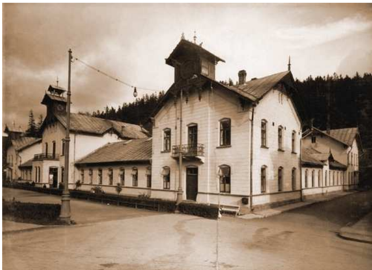
Fot. 3. Stare Łazienki Mineralne (1857 – 66) arch. Feliks Księżarski

Najważniejszym w Krynicy budynkiem autorstwa arch. Feliksa Księżarskiego są Stare Łazienki Mineralne (1857 – 66). Jest to budowla drewniana, która z czasem została otynkowana. Obiekt składa się z trzech dwutraktowych skrzydeł – frontowego oraz skrzydeł bocznych. Architektura Starych Łazienek Mineralnych wzorowana była na budowlach uzdrowiska Franzenbad, do którego udał się Księżarski przed podjęciem zlecenia.