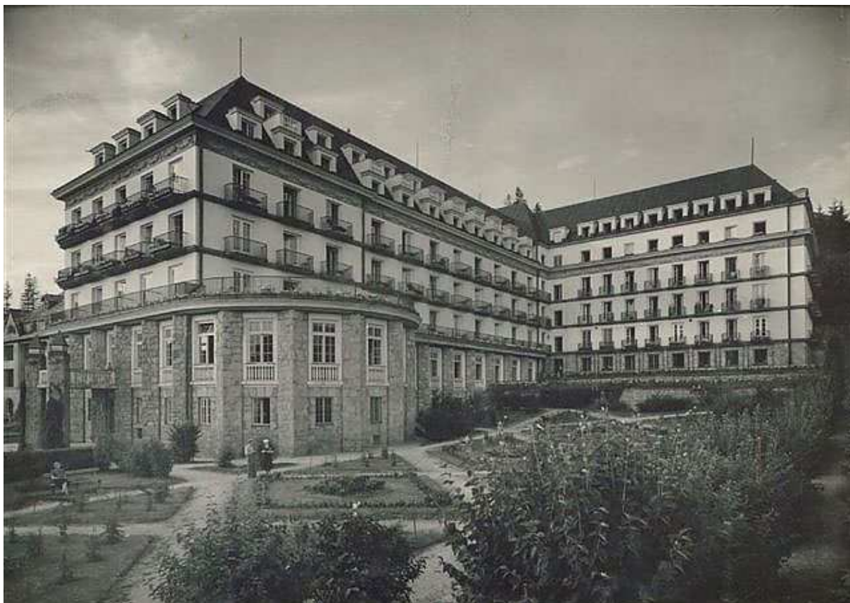
Fot. 13. Sanatorium Lwigród (1929), arch. Eugeniusz Czerwiński

Kolejnym budynkiem potwierdzającym renomę międzywojennej Krynicy było Sanatorium Lwigród , wzniesione w 1929 roku ze składek lwowskich urzędników, autorstwa wybitnego architekta Eugeniusza Czerwińskiego. Był on absolwentem, a następnie Profesorem Politechniki Lwowskiej. Był także autorem wielu prestiżowych realizacji, między innymi, we współpracy z arch. Alfredem Zachariewiczem, Gmachu Poczty Głównej we Lwowie, a także Pawilonów Targów Wschodnich w latach 1921 – 1924, lwowskiego kinoteatru Palace czy Domu Techników Politechniki Lwowskiej 26 .