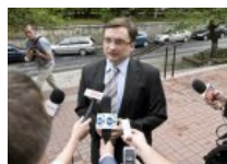
Wyzwanie rzucone Ziobrze