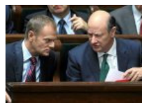
Podatnicy odetchnęli z ulgą