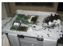
Śmiertelne paczki Al-Kaidy